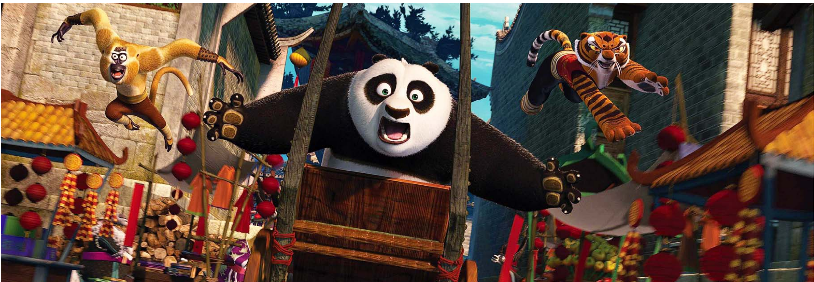
PERFEKTIONISME? Kina ville have fremstillet pandaen Po som perfekt frem for klodset, doven og overvægtig, som han var i den vestlige 'Kung Fu Panda'. Og dermed ville kineserne have gjort ham uelskelig.